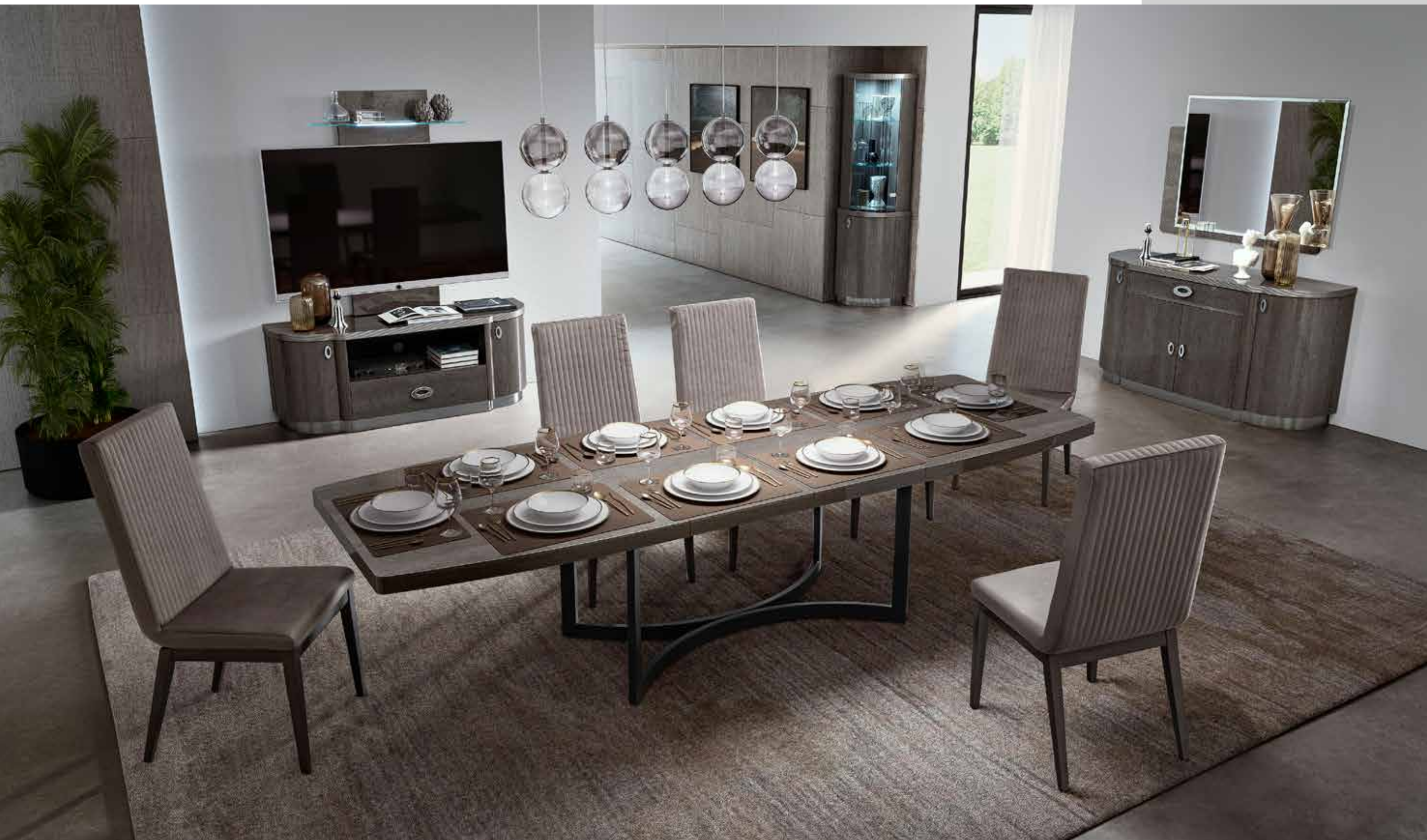
Solidità e robustezza dati anche da un importante zoccolo in legno multistrato curvato a onda e rivestito con una lamina effetto nickel. Strength and solidity to each piece of the collection is also provided by an important base skirt in multi-layer wood, wave shaped and covered with a nickel effect sheet .