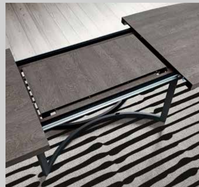
The details make the difference!