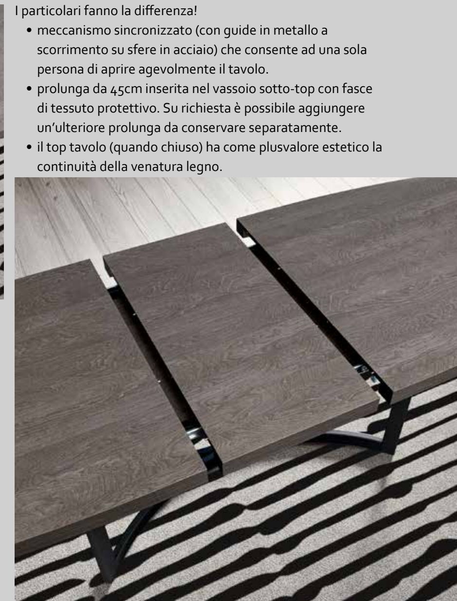
I particolari fanno la differenza!