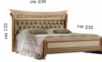
Upholstered Bed art. 201 King size 180/200x200 cm Letto imbottito art. 201 Кровать с набивным изголовьем art. 201