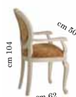
Armchair art. 200 Sedia c/braccioli art. 200 Стул с подлокотниками art. 200