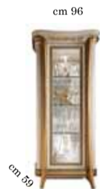
1/door glass cabinet Vetrina 1/anta Витрина однодверная