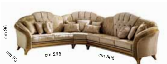
Corner Sofa (2/seats+corner+3/seats) Divano ad angolo (2/posti+angolo+3/posti) Угловой диван (2-х местный диван + Угловой элемент +3-х местный диван)

Arredoclassic Srl may introduce technical and stylistic changes to improve the production process. No complaints will be accepted if the product delivered is not exactly the same as the product photographed.