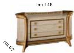
3/drawers dresser Comò 3/cassetti Комод с 3 ящиками