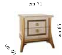
Night table Comodino Тумбочка