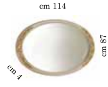
Mirror for 3/dr. dresser (and dressing table) Specchiera piccola per comò 3/cass. o toilette Зеркало для комода с 3 я. и туал. столика