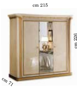
3/doors wardrobe h. 226 Armadio 3/ante h. 226 3-х дверный шкаф h. 226