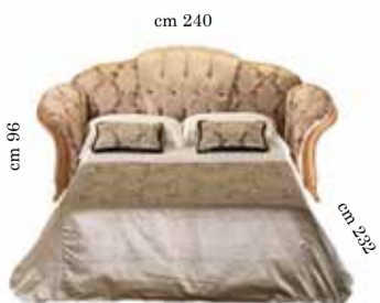
3/seats sofa with bed Divano 3/posti con letto 3-х местный диван с раскладным механизмом