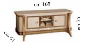
TV cabinet Art. 200 Mobile porta TV Art. 200 Тумба под тв Art. 200