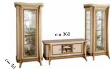
TV set composition N. 15 Composizione vetrine/TV N. 15 Стенка под тв comp.15