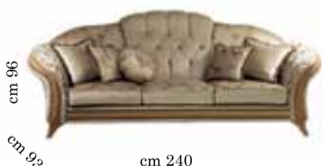
3/seats sofa Divano 3/posti 3-х местный диван