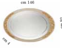
Mirror for 3/doors buffet Specchiera per contr. 3/ante Зеркало для 3 х дверного прилавка