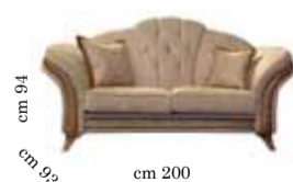
2/seats sofa Divano 2/posti 2-х местный диван