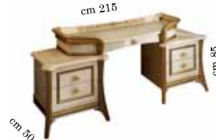
Dressing table Toilette Туалетный столик с ящиками