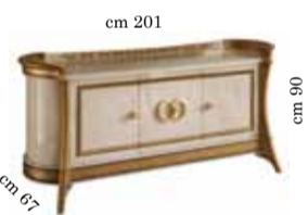
3/doors buffet Contromobile 3/ante 3-х дверный прилавок