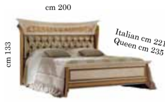
Upholstered Bed art. 201 Queen or Italian size 160x190/200 cm Letto imbottito art. 201 Кровать с набивным изголовьем art. 201