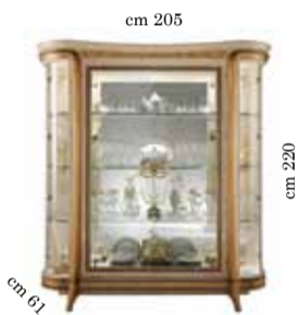
4/doors glass cabinet Vetrina 4/ante 4-х дверная витрина