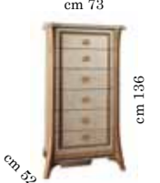
Tall chest Settimino Высокий комод