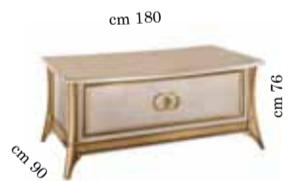
Desk Scrivania Письменный стол