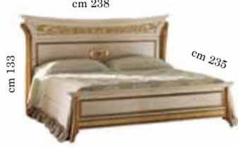
Bed art. 200 King size 180/200x200 cm Letto art. 200 King Кровать art. 200