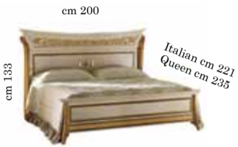
Bed art. 200 Queen or Italian size 160x190/200 cm Letto art. 200 Кровать art. 200