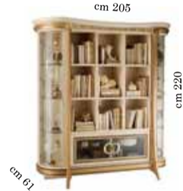
Bookcase Libreria Библиотека