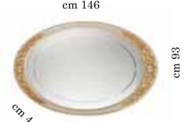
Large mirror for dressing table Specchiera grande per toilette Зеркало для туал. столика