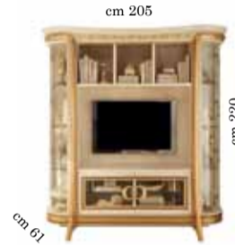
TV Wall unit comp. N. 20 Mobile TV comp. 20 Стенка под тв comp.20