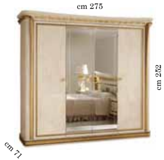
4/doors wardrobe h. 252 Armadio 4/ante h. 252 4-х дверный шкаф h. 252