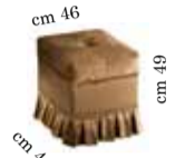
Pouf Pouf Пуф