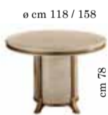
Round table with 1/extension Tavolo rotondo con 1/allungo Круглый стол раздвижной