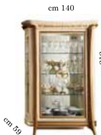
2/doors glass cabinet Vetrina 2/ante 2-х дверная витрина