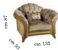
Armchair Poltrona Кресло