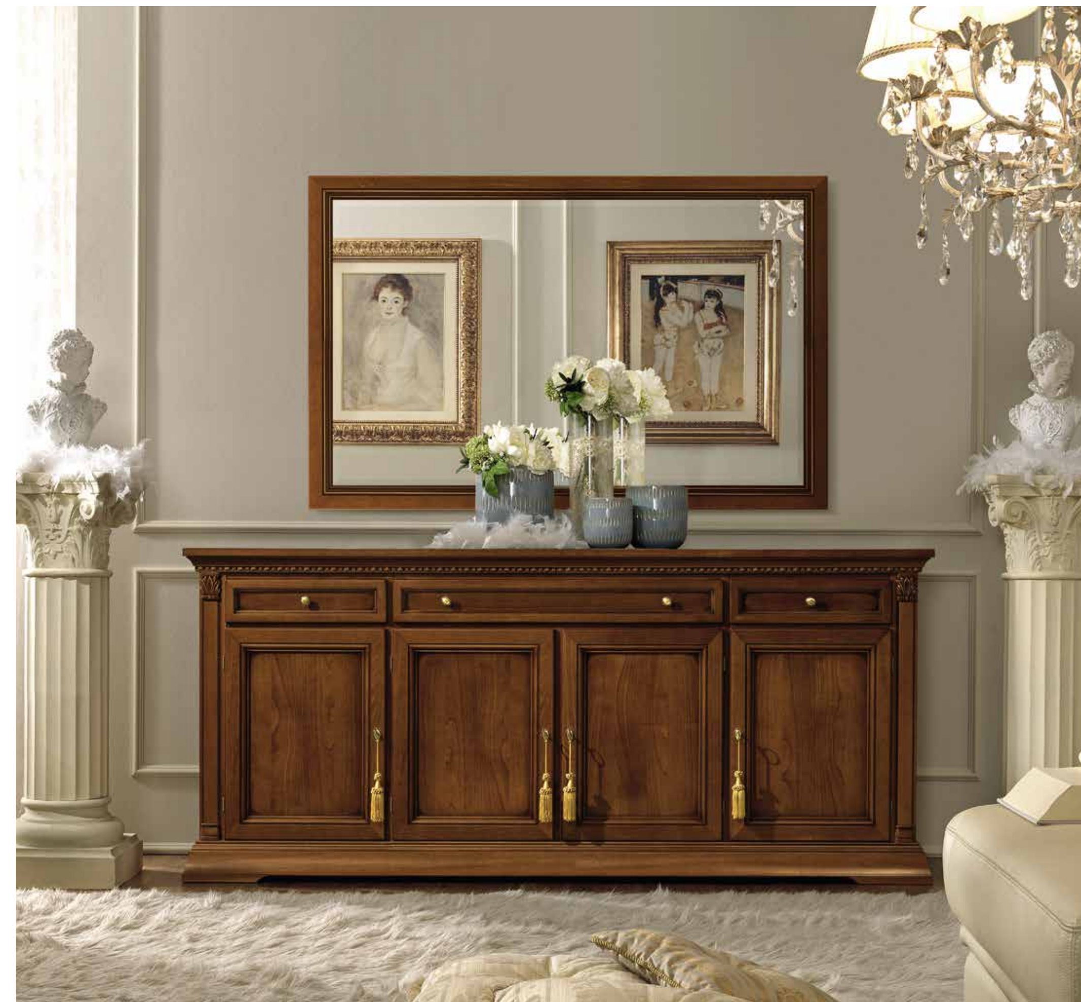
Credenza a quattro ante.