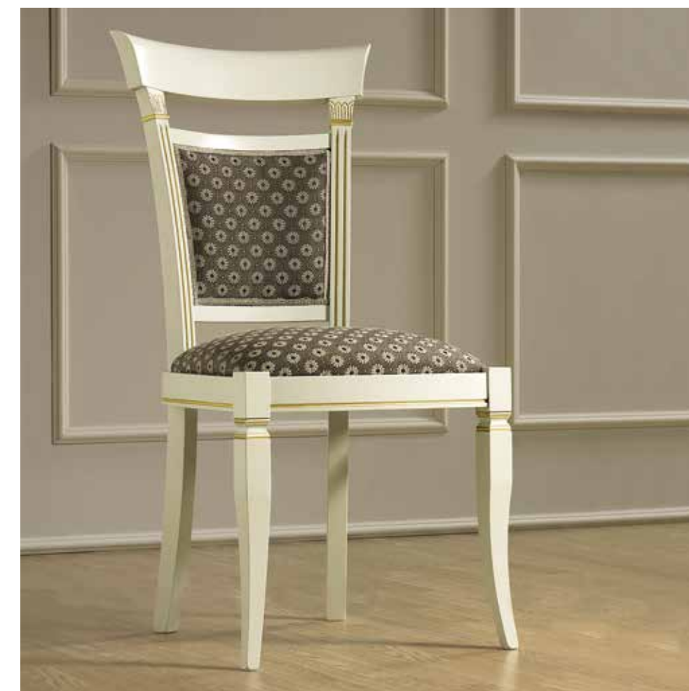
COD. 134SED.01FRMS75 - SATURN 9