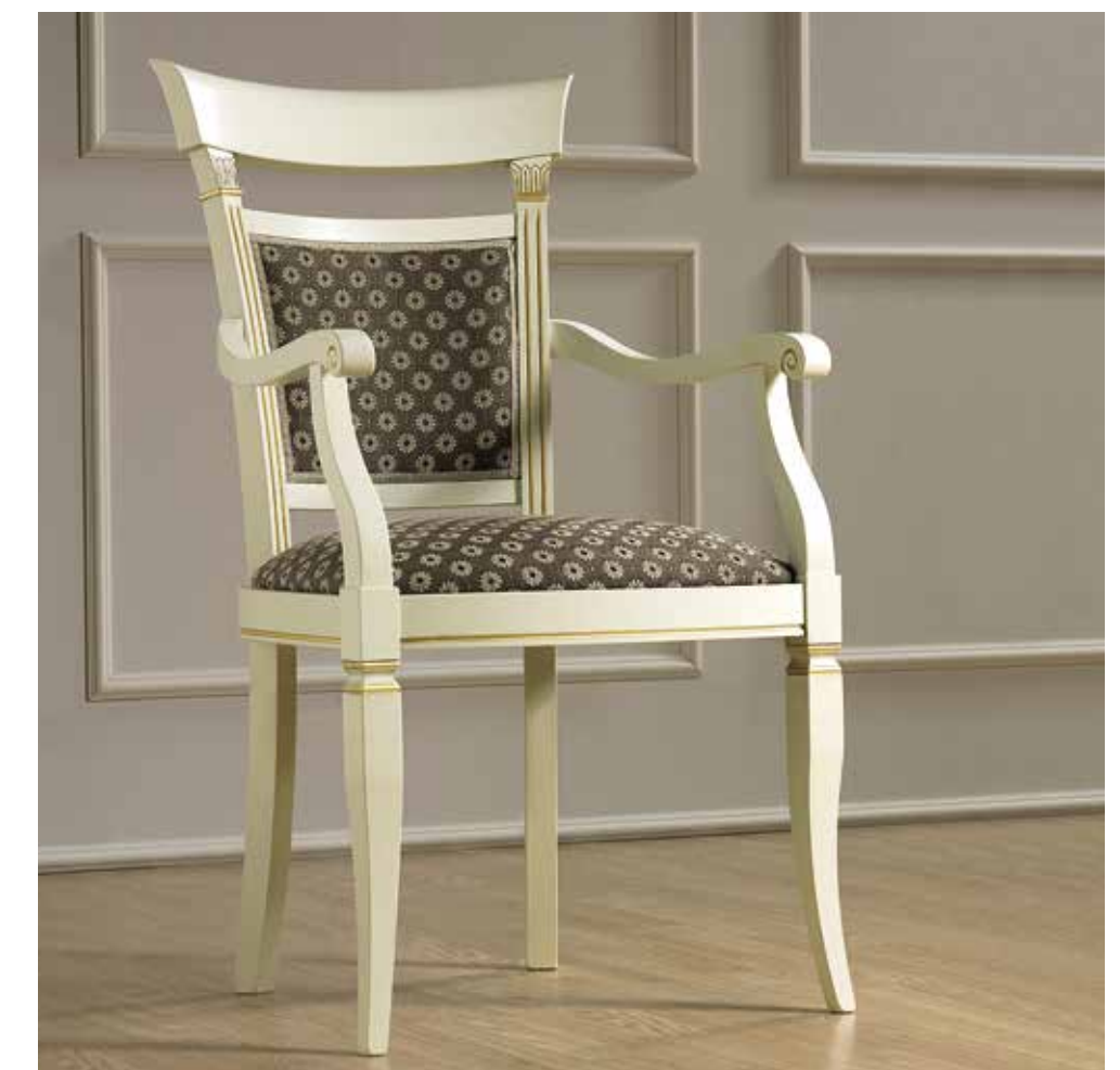
COD. 134CAP.01FRMS75 - SATURN 9