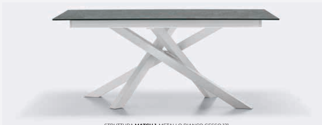
STRUTTURA MATCH 1 , METALLO BIANCO GESSO 121. MATCH 1 FRAME, CHALK WHITE 121 METAL.