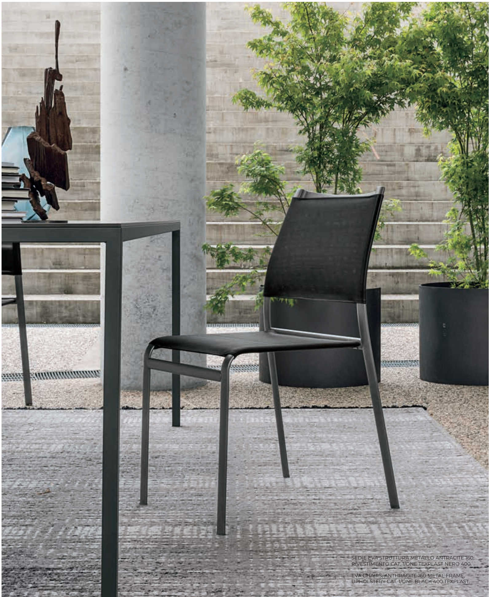
SEDIE EVA STRUTTURA METALLO ANTRACITE 160, RIVESTIMENTO CAT. 1/ONE TEXPLAST NERO 400. EVA CHAIRS, ANTHRACITE 160 METAL FRAME, UPHOLSTERY CAT. 1/ONE BLACK 400 TEXPLAST.