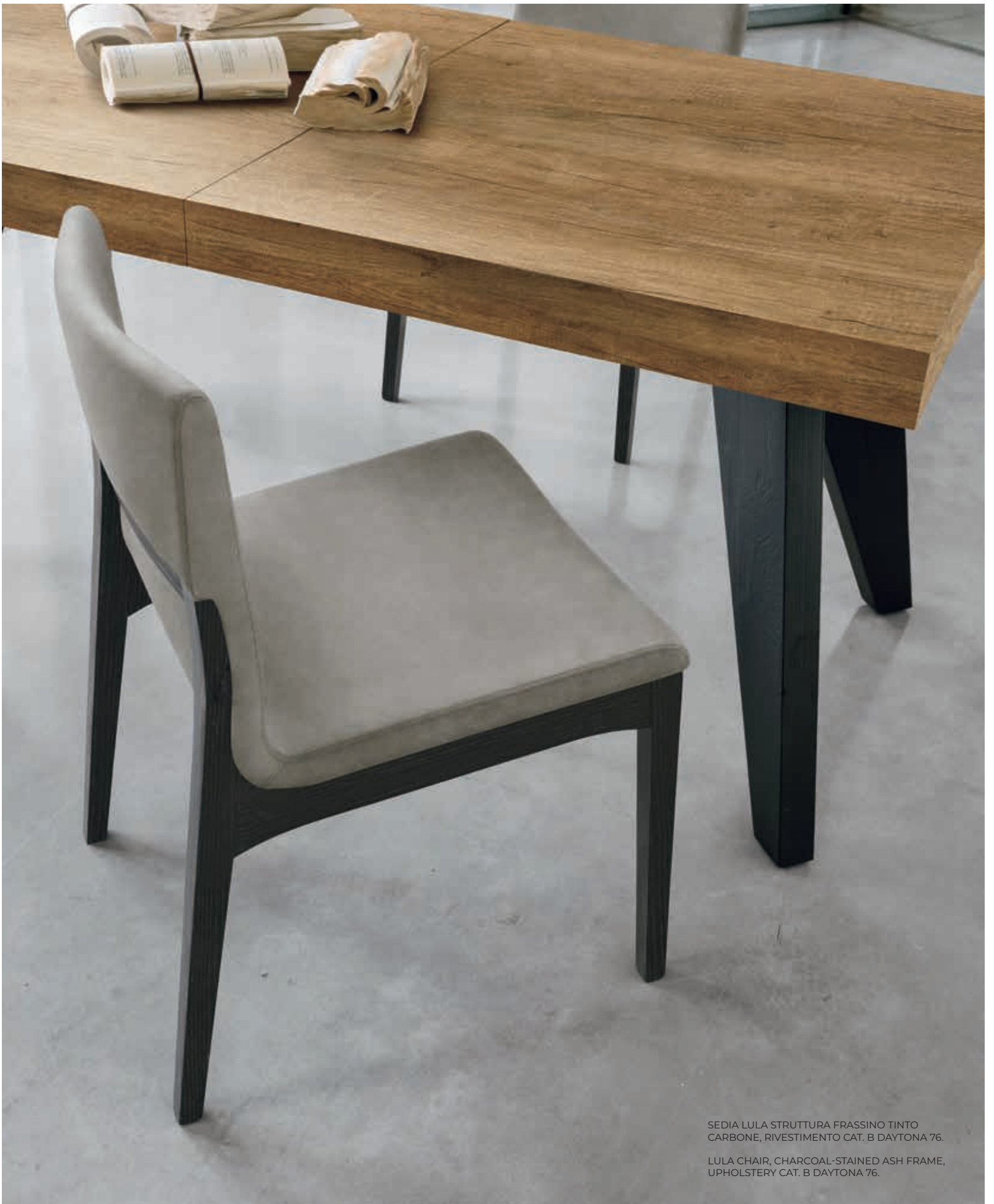
SEDIA LULA STRUTTURA FRASSINO TINTO CARBONE, RIVESTIMENTO CAT. B DAYTONA 76.