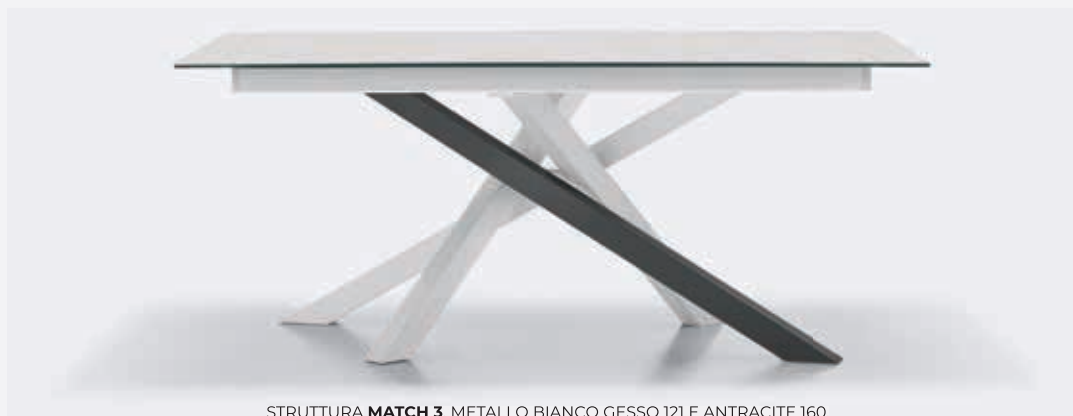
STRUTTURA MATCH 3 , METALLO BIANCO GESSO 121 E ANTRACITE 160. MATCH 3 FRAME, CHALK WHITE 121 AND ANTHRACITE 160 METAL.