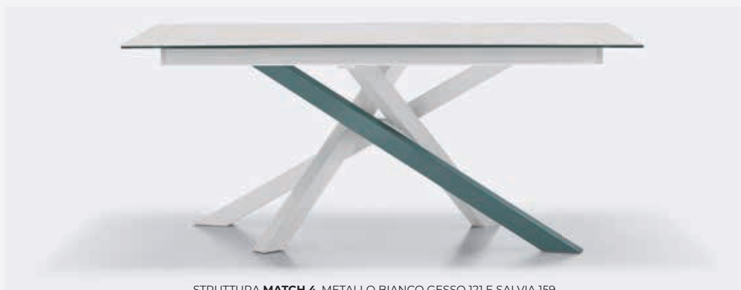
STRUTTURA MATCH 4 , METALLO BIANCO GESSO 121 E SALVIA 159. MATCH 4 FRAME, CHALK WHITE 121 AND SAGE 159 METAL.