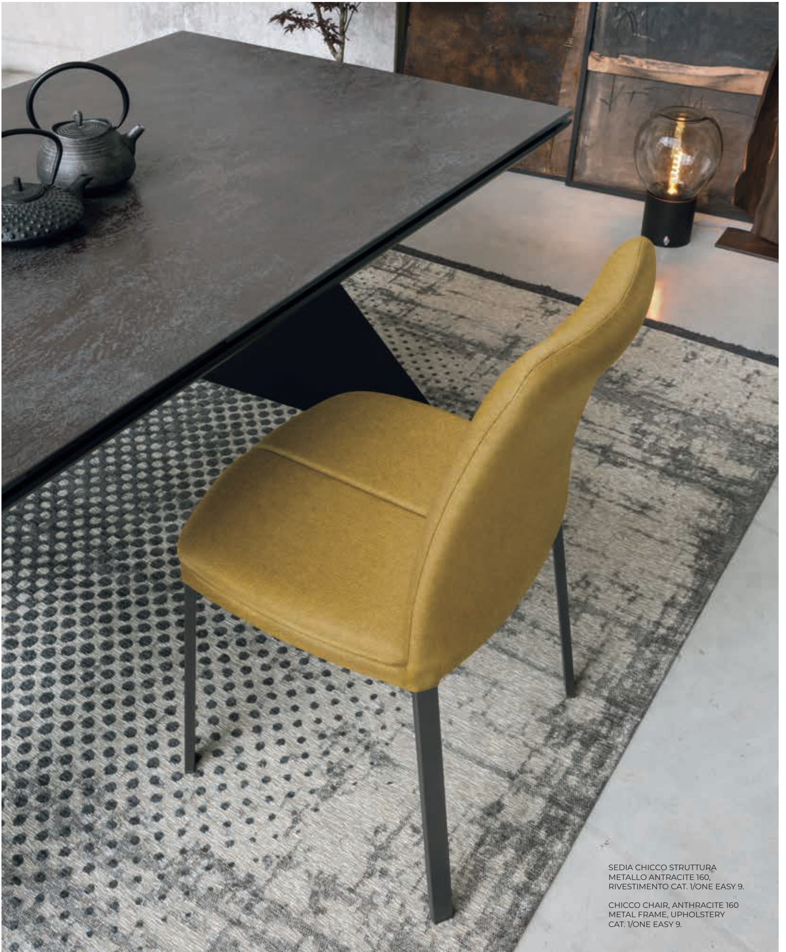
SEDIA CHICCO STRUTTURA METALLO ANTRACITE 160, RIVESTIMENTO CAT. 1/ONE EASY 9.