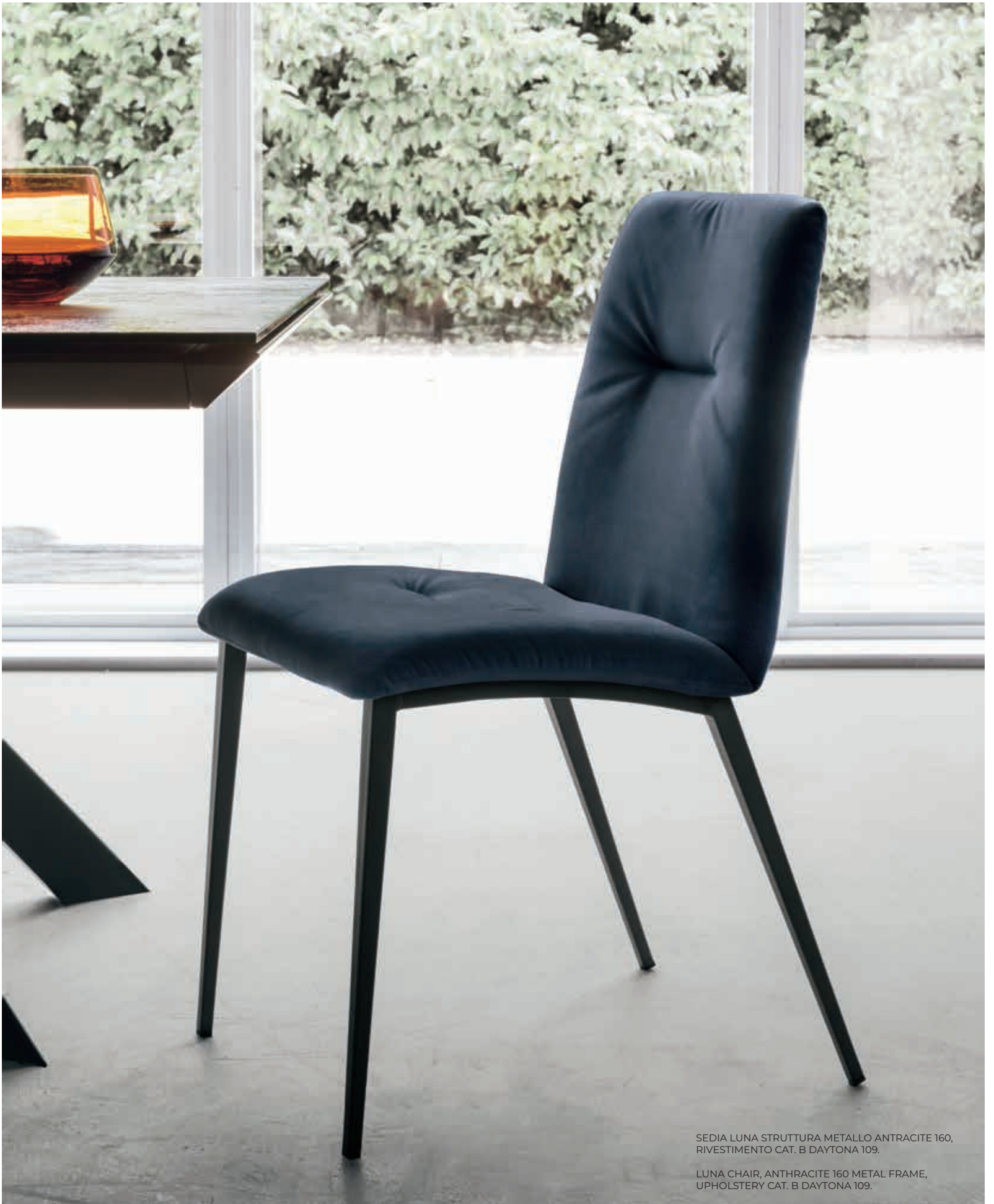
SEDA LUNA STRUTTURA METALLO ANTRACITE 160, RIVESTIMENTO CAT. B DAYTONA 109.