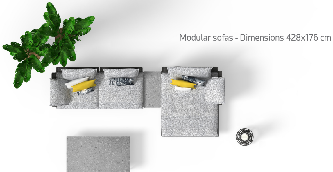
Modular sofas - Dimensions 428x176 cm