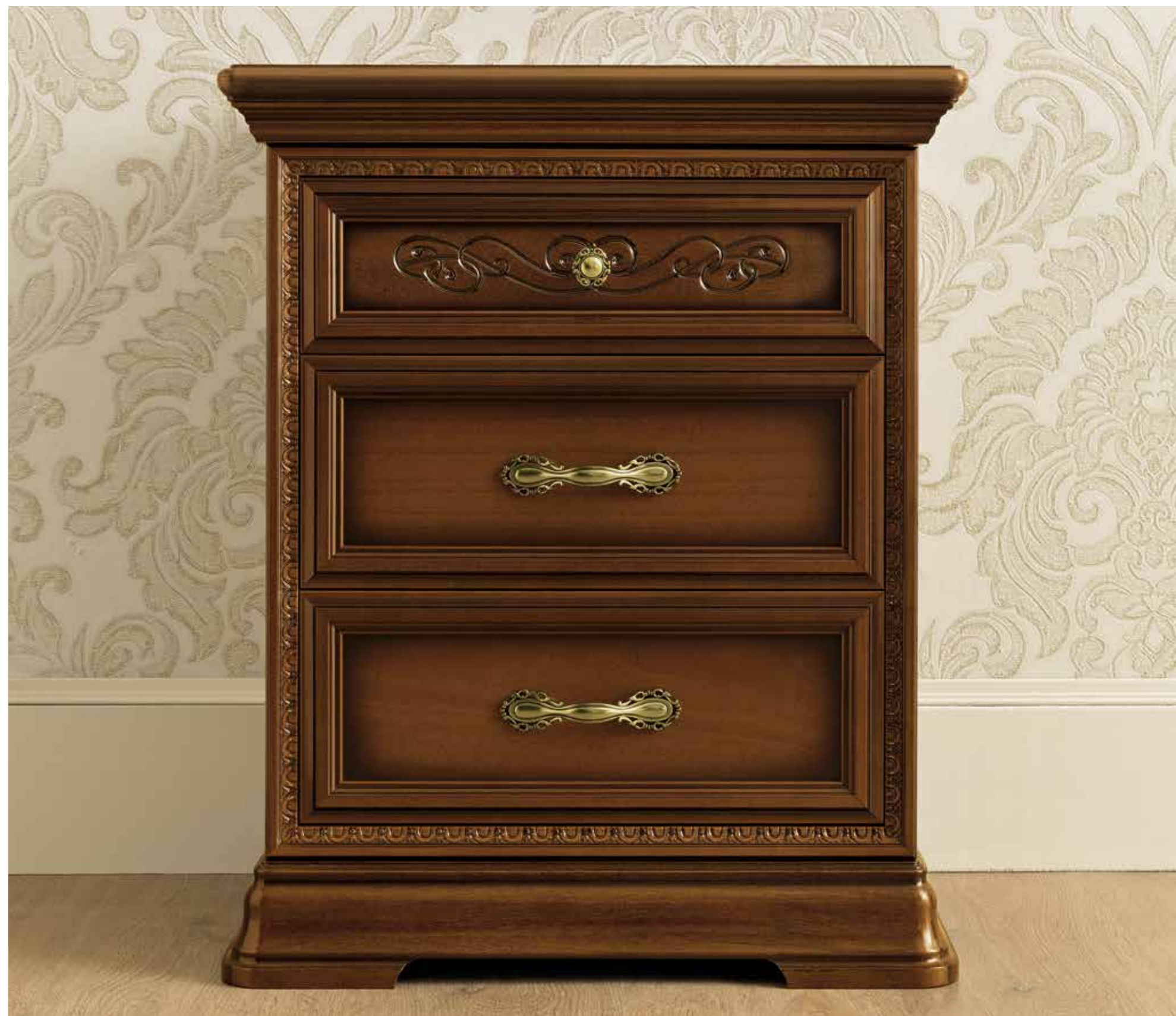
Primo cassetto con nuovo intaglio. First drawer with new carving. Верхний ящик с новой резьбой.