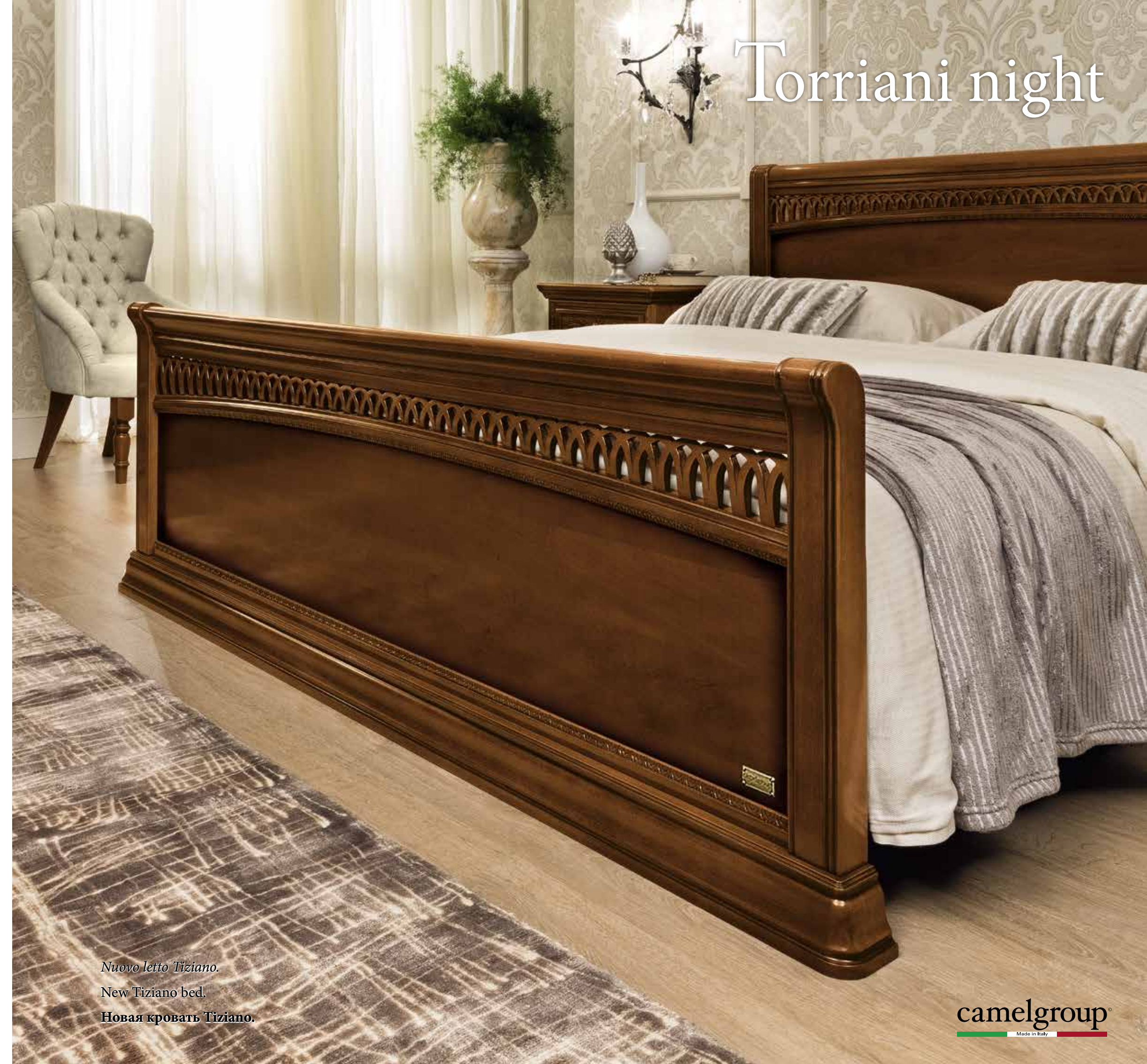
Nuovo letto Tiziano. New Tiziano bed. Новая кровать Tiziano.